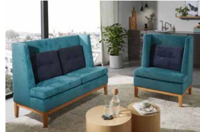
ALTO DINING SOFA Gründerzeitsofa, modern interpretiert