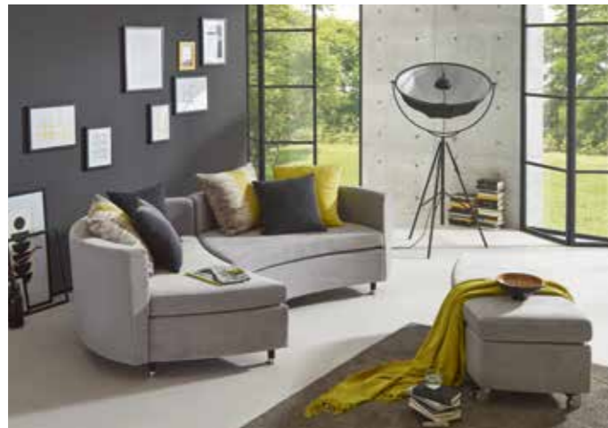
SERENE Die pfiffige Kuschelwiese