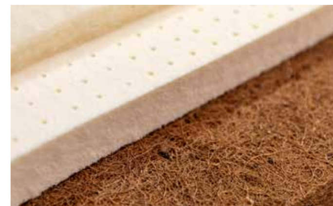
Schafschurwolle, Naturlatex, latexierter Kokos