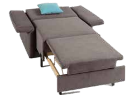
Schlafsessel 80 B 102/140 cm / T 93 cm / H 96 cm Sitzhöhe/-tiefe: 45 cm / 51 cm Liegefläche: ca. 80 x 199 cm