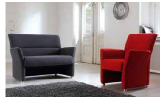
NOLA Zierlicher Einzelsessel und 2-sitziges Sofa