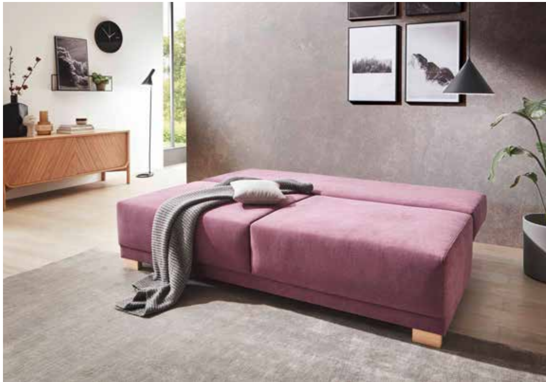
B 198 cm / T 100 cm / H 87 cm Sitzhöhe/-tiefe: 42 cm / 52 cm Liegefläche: ca. 198 x 143 cm

Unser MOOD ist ein wahrer Stimmungsaufheller an anstrengenden Tagen und lädt einfach zum Fallenlassen ein. Sein geradliniges Design ohne überflüssiges Beiwerk entzückt nicht nur Puristen. Die großzügige Liegebreite bietet bequem Platz für zwei Personen und muss sich als ebenbürtiger Bettersatz nicht verstecken.