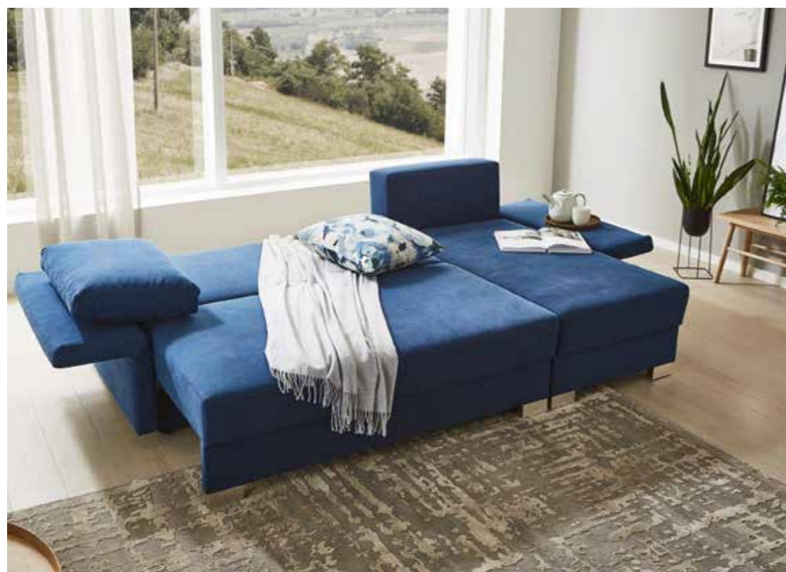
NEO mit Recamiere 150 B 234/286 cm, T 100/150 cm, H 86 cm Liegefläche: 140/125 x 210 cm

Ganz nach Wunsch: Armlehnen feststehend oder klappbar.