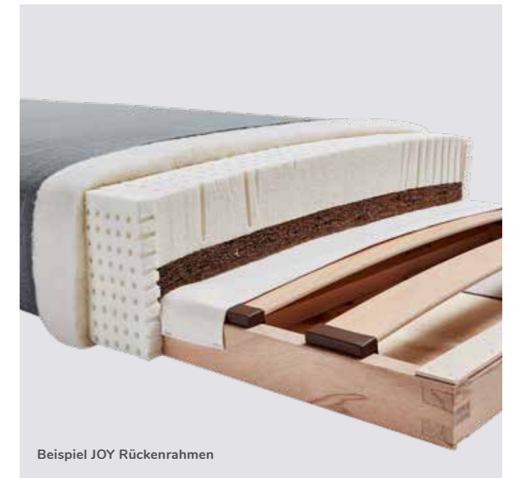
Beispiel JOY Rückenrahmen

Bei der Gewinnung als auch bei allen Stufen der Verarbeitung werden immer ökologische und soziale Aspekte beachtet – aus Überzeugung.