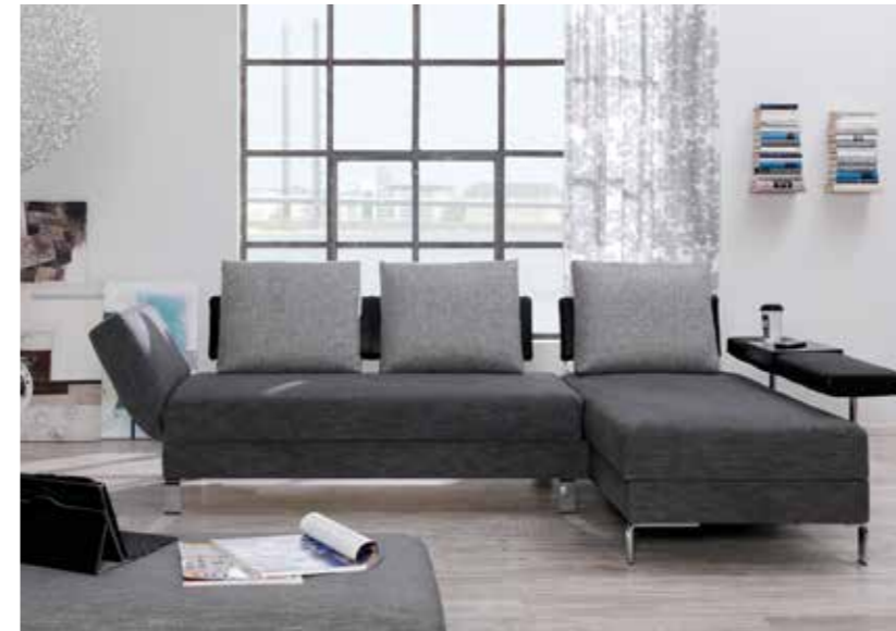
SOLO Liege mit Anstellsofa