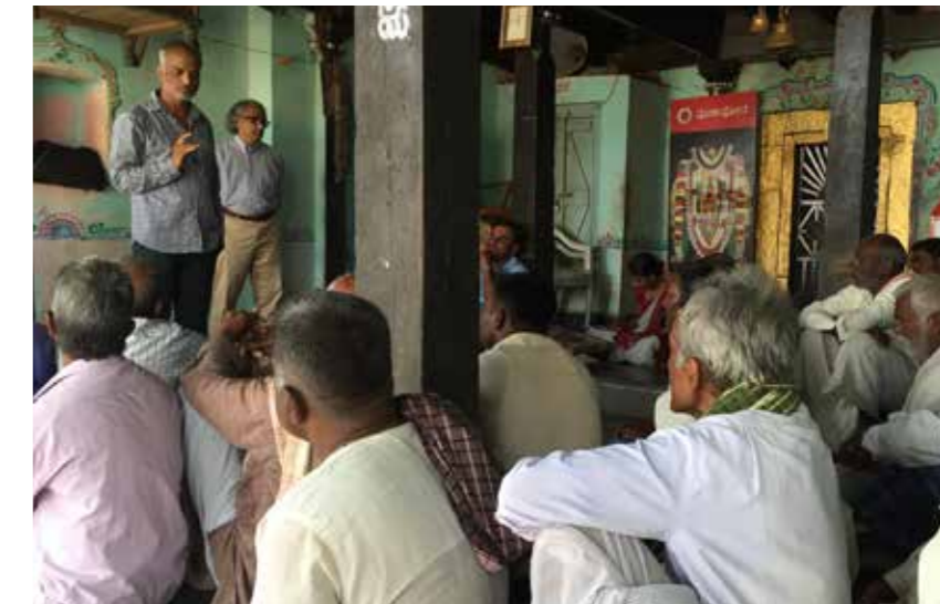
Versammlung von Kleinbauern in Indien

In vielen Anbauländern gehört die Ausbeutung der Kleinbauern leider immer noch zum Alltag. Sozialverträgliche Arbeitsbedingungen sind oft eine Seltenheit. Für MAL Germany war es von Anfang an ein wesentliches Anliegen, nicht nur gesunde Produkte herzustellen, sondern auch die lokalen Arbeiter*innen und deren Familien in Indien und Sri Lanka zu unterstützen. Durch Sachspenden, Workshops, Schulungen und die prozentuale Rückführung von Verkaufserlösen in das Ursprungsland kümmert sich der Fund darum, dass alle und nicht nur wenige profitieren.