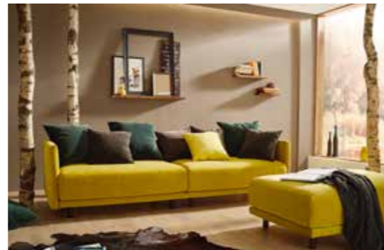
RIVA Kreatives Modulsystem mit abnehmbaren Bezügen