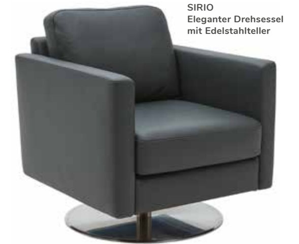
SIRIO Eleganter Drehsessel mit Edelstahlsteller