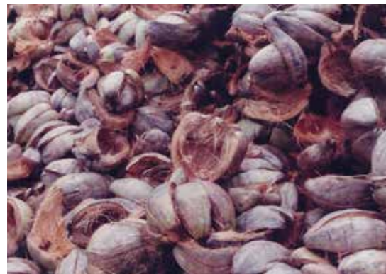
Kokosshalen zur Fasergewinnung