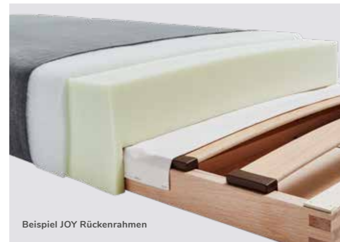
Beispiel JOY Rückenrahmen

Ein vernünftiger und solider Aufbau der Polsterung gehört mit zum Herzstück unserer Schlafsofas. Denn wie man polstert, so liegt man am Ende auch. Bequem, gesund und gemütlich. Neben Kaltschaumpolsterungen verwenden wir für unsere hochwertigen Auflagen auch Naturpolsterungen. Und beide Arten sind im Aufbau gut durchdacht.