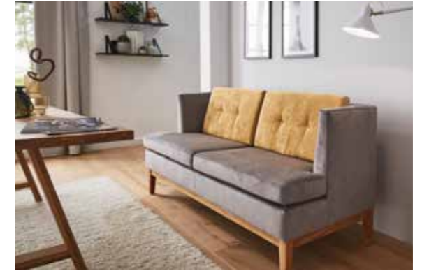
PICO DINING SOFA In klassischer, zierlicher Form