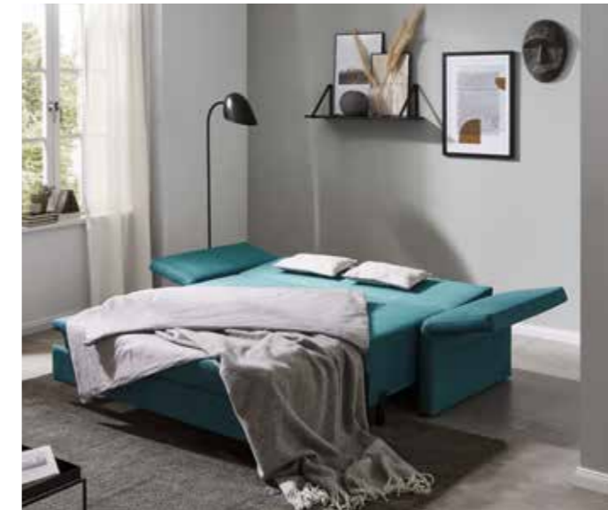
Schlafsofa 140 B 166/228 cm / T 93 cm / H 105 cm Sitzhöhe/-tiefe: 45 cm / 54 cm Liegefläche: ca. 140 x 199 cm Armlehnenhöhe: 80 cm

Urgemütlich, mit hohen Armlehnen und soften Rückenissen – das ist CASSINO. Dieses komfortable Schlafsofa schmeichelt Ihrem Körper, egal ob Sie einfach nur entspannt sitzen möchten, ungestört schlafen oder nach getaner Arbeit entschleunigen wollen.