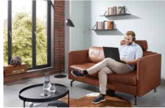
SIRIO Klassisches Einzelsofa und flexible Wohnlandschaft mit vielen Armlehnenformen