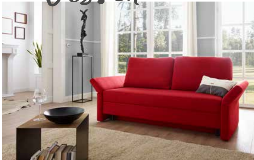
Schlafsofa 160 B 186/224 cm / T 93 cm / H 96 cm Sitzhöhe/-tiefe: 45 cm / 51 cm Liegefläche: ca. 160 x 199 cm Armlehnenhöhe: 68 cm